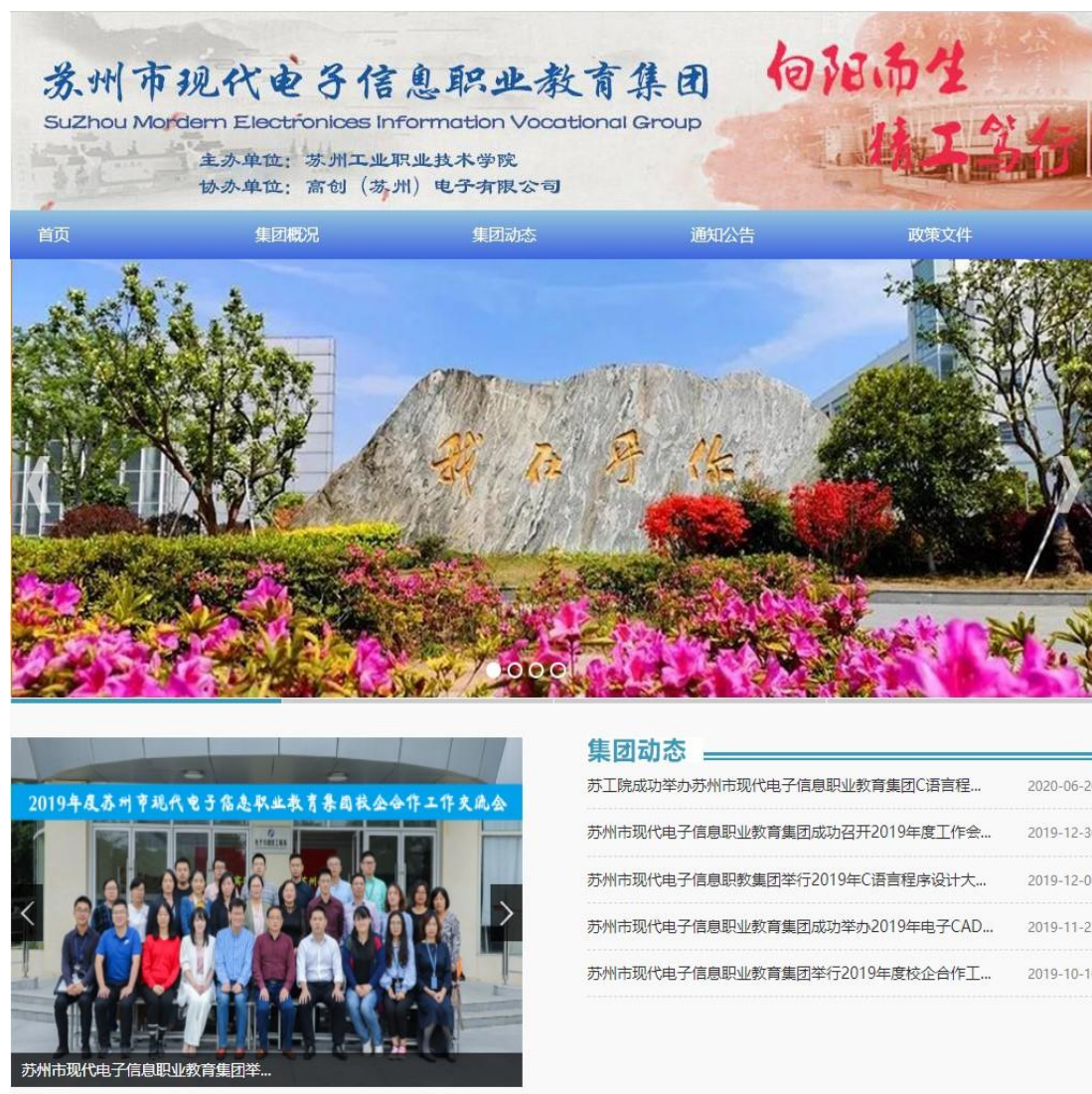
图6 苏州现代电子信息职业教育集团官网主页

京东方（高创）公司联合苏工院电信系以用“筑平台”、“组团队”、“育英才”、“强服务”四步出发，第一步打好基础，做强平台建设，共同建设苏州现代电子信息职业教育集团，简称“苏州现代电子信息职教集团”（Suzhou Vocational Education Group of Modern Electronics & Information）。集团以行企校合作为基础，以电子信息类专业为纽带，以服务苏州经济建设和社会发展为宗旨，以