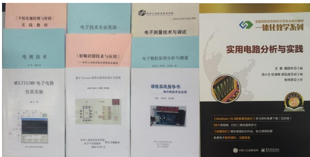
图14 其他合作编写校本教材