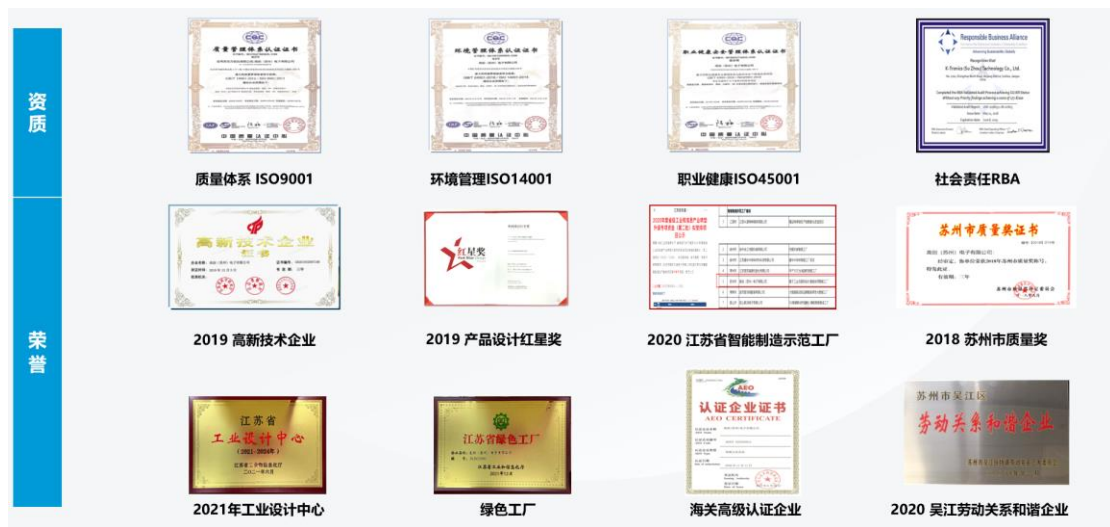
图 3 企业获得荣誉