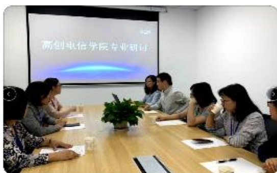
图11 校企专业建设研讨

校企定期研讨行业发展方向、专业人才培养方案制订、集成电路新专业人才培养方案制定和规划、实训基地建设方案等；围绕应用电子专业转型，在企业开展多次教研活动。校企以企业典型案例为载体，进行新建课程《集成电路导论》、《项目化版图设计》、《集成电路测试与验证》等课程建设，建设在线开放课程、资源库等。江苏省“十四五”首批职业教育规划教材2本：《数字电子技术项目教程》（第2版）、《电子EDA技术Multisim》；1门课程获得学院精品在线开放课程立项。