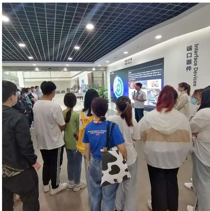
图8 校外实习实训基地识岗

的充分利用与高效共享，真正实现了“群内小共享、区域大共享”。另一方面，在苏工院实施“三室”学习和企业“三岗”实践，开发京东方（高创）典型的项目案例实现集实践性、开放性和职业性于一体的真实项目、真实设备、真实要求的“三真”立体式实践教学，强化实践育人，实现资源深度共享，满足苏工院学生专业技能、综合技能训练的需要，为学生创新、创业能力培养提供条件。