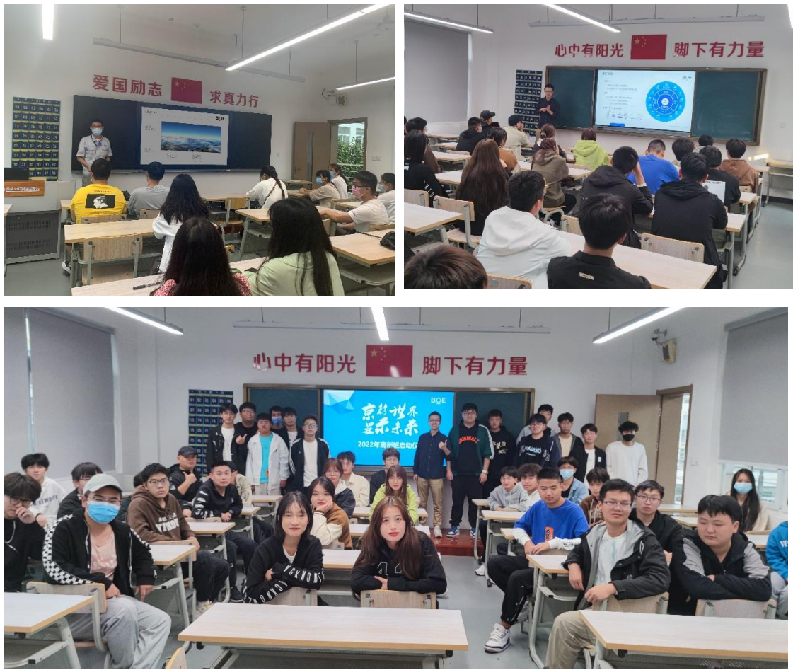
图4 订单班、冠名班活动组图