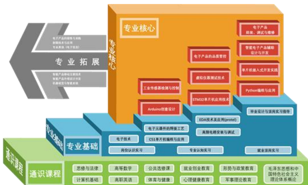
图10 应用电子技术专业课程体系架构

校企定期研讨行业发展方向、专业人才培养方案制订、集成电路新专业人才培养方案制定和规划、实训基地建设方案等；围绕应用电子专业转型，在企业开展多次教研活动。校企以企业典型案例为载体，进行新建课程《集成电路导论》、《项目化版图设计》、《集成电路测试与验证》等课程建设，建设在线开放课程、资源库等。江苏省“十四五”首批职业教育规划教材2本：《数字电子技术项目教程》（第2版）、《电子EDA技术Multisim》；1门课程获得学院精品在线开放课程立项。