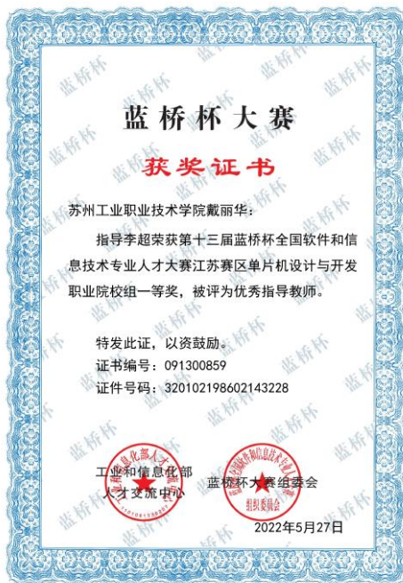
图5 2022年蓝桥杯江苏省一等奖