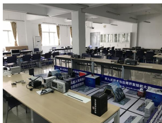
图9 共建技能创新中心