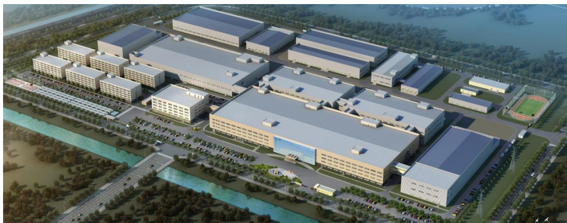
图 2 高创（苏州）电子有限公司

BOE（京东方）在北京、合肥、成都、重庆、福州、绵阳、武汉、昆明、苏州、鄂尔多斯、固安等地拥有多个制造基地，子公司遍布美国、加拿大、德国、英国、法国、瑞士、日本、韩国、新加坡、印度、俄罗斯、巴西、阿联酋等 20 个国家和地区，服务体系覆盖欧、美、亚、非等全球主要地区。